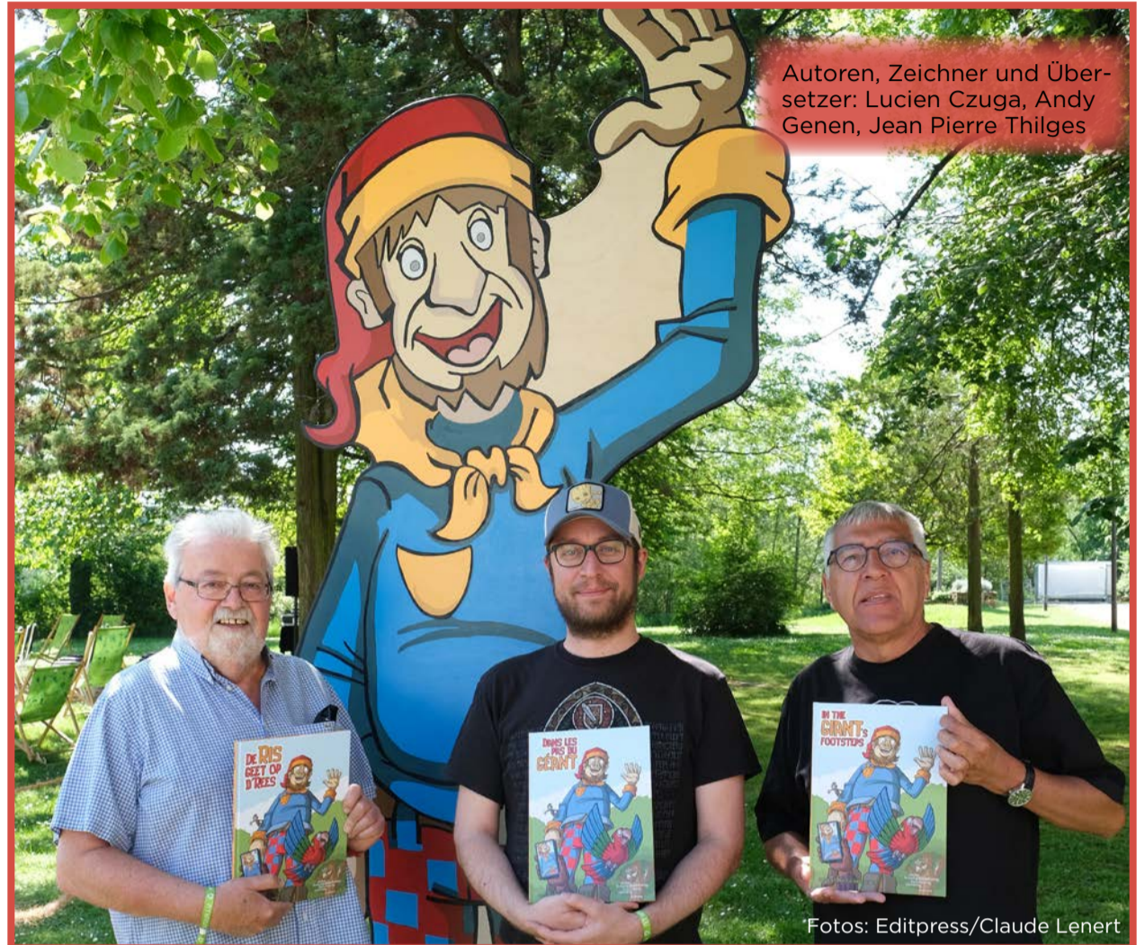
Autoren, Zeichner und Übersetzer: Lucien Czuga, Andy Genen, Jean Pierre Thilges

Ab heute, eigentlich seit gestern, dem Feiertag, ist die BD erhältlich, in Französisch, Englisch und Luxemburgisch. Es ist eine kurzweilige Geschichte mit mehr oder weniger bekannten Gesellen aus der Südgemeinde. Der Bürgermeister der Gemeinde ist übrigens ein Außerirdischer! Oder doch nicht. Tja, lesen Sie selbst.