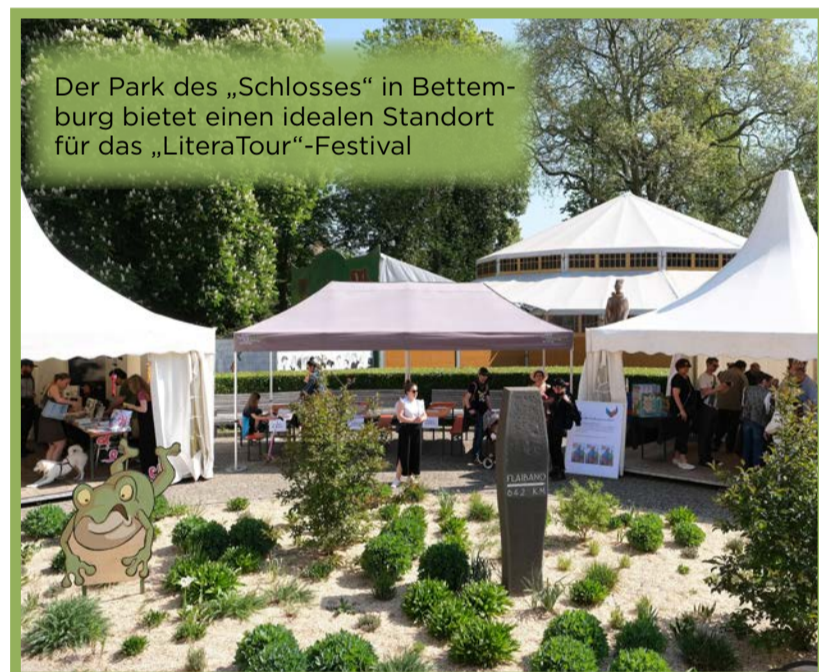
Der Park des „Schlosses“ in Bettemburg bietet einen idealen Standort für das „LiteraTour“-Festival