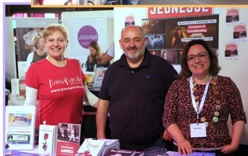
E viva l'Italia: Seit 18 Jahren gibt es das Magazin „Passa-Parola“