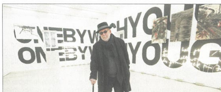
Der Künstler Joseph Kosuth steht im Michel Majerus Estate in der von ihm gestalteten Installation »kosuth majerus sonderborg«

Mit einer bundesweiten Ausstellungsreihe 20 Jahre nach seinem Tod wollen Museen und Galerien in ganz Deutschland an das Werk des luxemburgischen Künstlers Michel Majerus (1967–2002) erinnern. Dabei soll »Michel Majerus 2022« nach Angaben vom Dienstag in Berlin an verschiedene Werkphasen und Aspekte des unter anderem für seine Popkultur bekannten Künstlers anknüpfen.