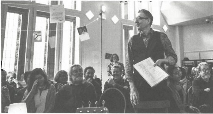
(Cie Nihilo Nihil)

Esch 2022, tout en poursuivant ses nombreuses activités sur les territoires des autres Communes participantes, pose ses valises à Bettembourg jusqu'au 21 mai. À l'affiche, un programme destiné à émerveiller petits et grands, avec des manifestations littéraires, des soirées musicales, des représentations théâtrales, ainsi que des contes féériques.